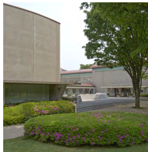
世田谷美術館・外観