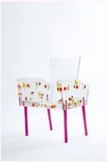
倉俣史朗《ミス・ブランチ》1988年 富山県美術館蔵 撮影：柳原良平 ©Kuramata Design Office

倉俣史朗(1934-1991)は、今なお世界から高い評価を受け、影響を与え続けているデザイナーです。アクリルやガラスのほか、建築用金属素材も用いた家具やインテリアの仕事は、見るものを日常の外へと誘い出す力を持っています。東京では20数年ぶりの個展となる本展覧会では、初期から晩年までの作品に加えて、その制作の背景となる夢日記やスケッチも紹介。倉俣史朗という人物に改めて向き合う機会となります。