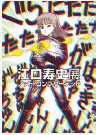
展覧会メインビジュアル