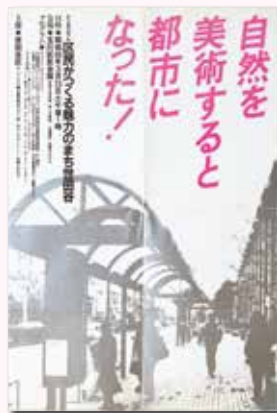
ポスター「シンポジウム 区民がつくる魅力のまち世田谷」 1985年 発行:世田谷区

12月25日10時以降HP申込フォームにて ※テーマや登壇者等、詳細は生活工房HPをご確認ください