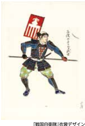
「戦国自衛隊」衣裳デザイン (角川春樹事務所 1979年)

※障害者割引あり ※企画展開催中は、企画展のチケットの半券で、本展をご覧ください