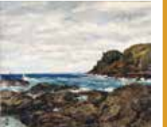
《奥能登の海》[石川県輪島市 曾々木海岸]1962年頃

草屋根民家のたたずむ姿に美を見出し、これを描くことに後半生をささげた向井潤吉(1901-1995)。本展では、向井がとらえた各地の特徴的な民家の姿とともに、旅先で向井が目に向けた、奈良の古道や和歌山の梅林などの、美しい自然の景色を織り交ぜてご紹介します。