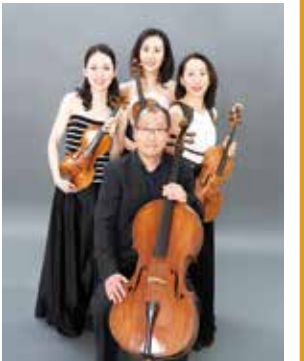
クアルテット・エクセルシオ