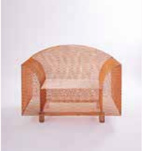
倉俣史朗「ハウ・ハイ・ザ・ムーン」1986年 富山県美術館蔵 撮影：柳原良平 ©Kuramata Design Office

倉俣史朗(1934-1991)は、今なお世界から高い評価を受け、影響を与え続けているデザイナーです。アクリルやガラスのほか、建築用金属素材も用いた家具やインテリアの仕事は、見るものを日常の外へと誘い出す力を持っています。東京では20数年ぶりの個展となる本展覧会では、初期から晩年までの作品に加えて、その制作の背景となる夢日記やスケッチも紹介。倉俣史朗という人物に改めて向き合う機会となります。