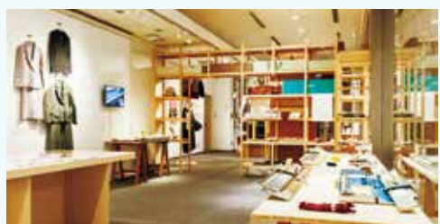
会場風景