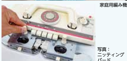
写真: ニッティング パード