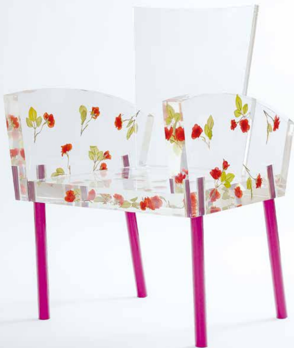
倉俣史朗《ミス・ブランチ》1988年 富山県美術館蔵 撮影：柳原良平 ©Kuramata Design Office

いまや伝説のデザイナーとも言える倉俣史朗。発表当時、センセーショナルな話題となった飲食店や服飾店の店舗デザインを手がけ、また独創的な家具を発表しました。没後30年を超えて、今新たに、倉俣史朗の人と作品を検証し、その詩情あふれるデザインを読み直します。