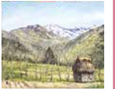
《不詳》[長野県更埴市森区] 1961年頃

草屋根民家のたたずむ姿に美を見出し、これを描くことに後半生をささげた向井潤吉(1901-1995)。本展では、向井がとらえた各地の代表的な民家の姿とともに、旅先で向井が目に向けた、奈良の古道や和歌山の梅林などの、美しい自然の景色を織り交ぜてご紹介します。