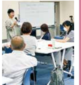
多文化理解講座(9月23日開催)「やさしい日本語で伝えよう」の様子