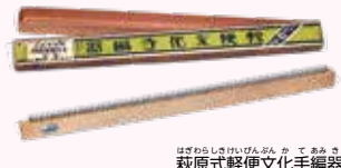
ほろろのり(ほろろのり) 萩原式軽便文化手編器