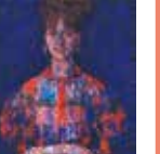
《青い背景》1960(昭和35)年頃

ひとつの主題を様々なヴァリエーションで描いた宮本三郎の、創意工夫と試行錯誤の跡がみとれる作品群を紹介。旺盛な探求心によって展開される、絵画の変奏曲をお楽しみください。