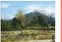
《古壁の秋》 奈良県奈良市高畑町福井、奈良新薬師寺近く(1971年)

草屋根民家のたたずむ姿に美を見出し、これを描くことに後半生をささげた向井潤吉(1901-1995)。本展では、向井がとらえた各地の特徴的な民家の姿とともに、旅先で向井が目に向けた、奈良の古道や和歌山の梅林などの、美しい自然の景色を織り交ぜてご紹介します。