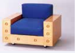
倉俣史朗(引出しの家具)1967年 富山県美術館蔵 ©Kuramata Design Office

倉俣史朗(1934-1991)は、今なお世界から高い評価を受け、影響を与え続けているデザイナーです。アクリルやガラスのほか、建築用金属素材も用いた家具やインテリアの仕事は、見るものを日常の外へと誘い出す力を持っています。東京では20数年ぶりの個展となる本展覧会では、初期から晩年までの作品に加えて、その制作の背景となる夢日記やスケッチも紹介。倉俣史朗という人物に改めて向き合う機会となります。