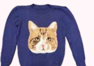
編み物☆堀ノ内「ネコのセーター」

戦後に流行した家庭用編み機を紹介する展覧会。大正時代の編み機や現代作家の作品など、およそ50点の資料を展示します。 ¥無料