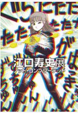
展覧会メインビジュアル

¥一般1,000(800)円/65歳以上、高校・大学生600(480)円/小・中学生300(240)円 ※( )内は20名以上の団体料金 ※障害者割引あり