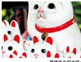
豪徳寺の招き猫