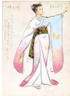
「大当たり三色姫」(1957年 東宝)デザイン画

※障害者割引あり ※企画展開催中は、企画展のチケットの半券で、本展をご覧ください