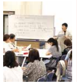
多文化理解講座(9月23日開催)「やさしい日本語で伝えよう」の様子