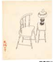
花森安治 カット原画(椅子とランプ) 『暮らしの手帖』1世紀5号 1949年10月1日

戦後の同時期に創刊され現在まで続く雑誌、『世界』(岩波書店)と『暮らしの手帖』(暮らしの手帖社)。絵画、版画、彫刻、現代美術など幅広い描き手による『世界』のカットと、花森安治の手掛けた『暮らしの手帖』のカットを、近年の収蔵品よりご紹介いたします。小コーナーでは、「魯山人の支援者一塩田岩治と南莞爾」と題し、北大路魯山人の作品を展示いたします。