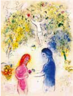
マルク・シャガール 屏絵(「ダフニスとクロエ」より) 1961年刊

愛溢れる世界を幻想的で色彩豊かに描いた画家マルク・シャガール(1887-1985)。彼は絵画と平行して版画制作にも熱心にとりくみ、数々の名作を生みだしました。版画独特の表現や鮮やかな色彩には絵画とはまた違う味わいがあります。本展では神奈川県立近代美術館の収蔵品から6つの版画集をご紹介します。技法や題材、制作の背景などにも着目しながらその魅力を読み解きます。