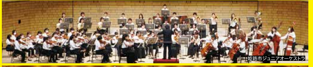
姫路市ジュニアオーケストラ