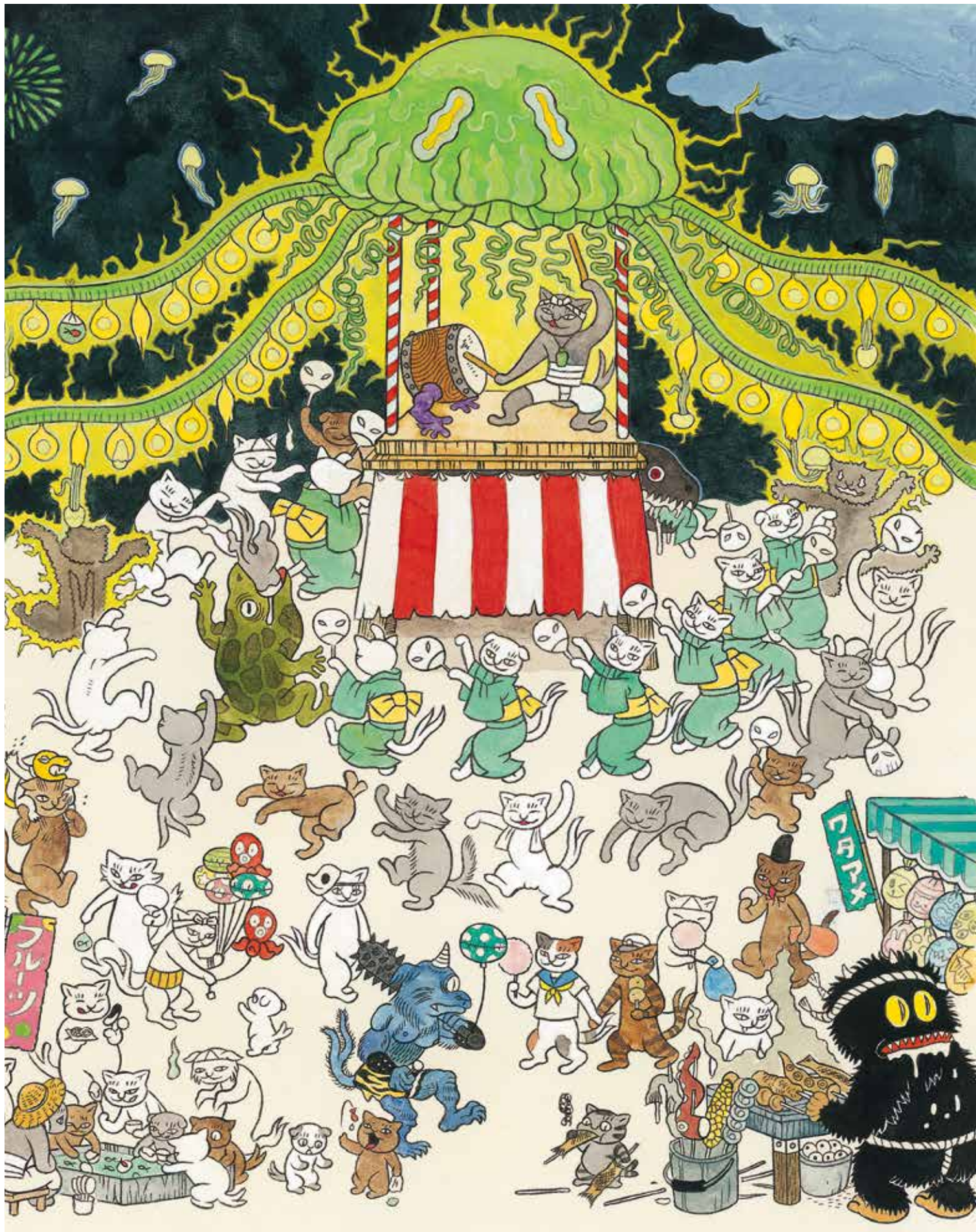
石黒亜矢子《ねこまたごよみ 葉月》2021年(部分)