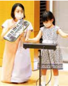
昨年の講座の様子