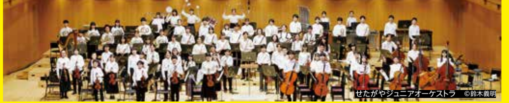
せたがやジュニアオーケストラ