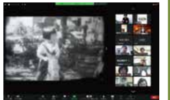
エトセトラの時間(2023年2月19日開催の様子)