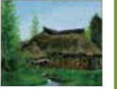
向井潤吉(水辺の曲り家) [岩手県稗貫郡大迫町内川目] 1976年

開館30周年を記念し、作者自選による寄贈作品28点を特別に一挙公開します。故郷の京都や好んで取材した長野、東北などを含む各地を描いた優品ぞろいの作品群をぜひお楽しみください。